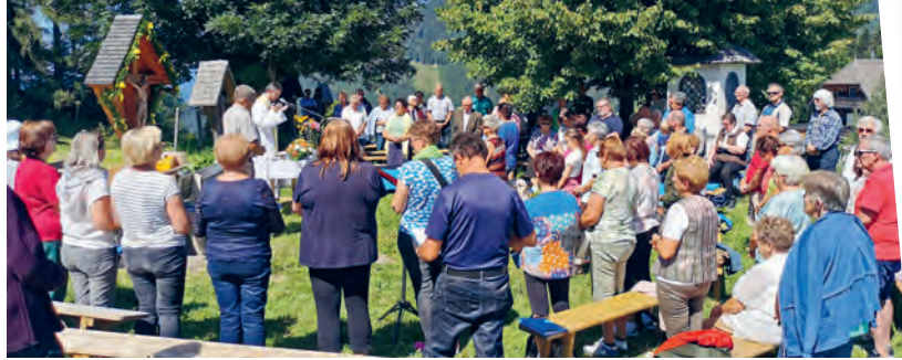
» Ein Höhepunkt – die Straßegger-Messe auf 1163 m Seehöhe

Menschen aller Zeiten, Kulturen und Religionen haben schon immer das Bedürfnis empfunden, Orte aufzusuchen, an denen ihnen der Himmel offener und Gott zugänglicher zu sein schien als anderswo. Wallfahren hat Tradition. Auch in Straden, Dietersdorf und Tieschen. So waren in den letzten Monaten viele Pfarrbewohner unterwegs. Zu Fuß, mit dem Rad, dem Auto oder Bus und sogar mit dem Traktor.