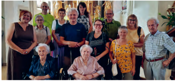
» Dietersdorfer Wallfahrer in St. Anna am Aigen