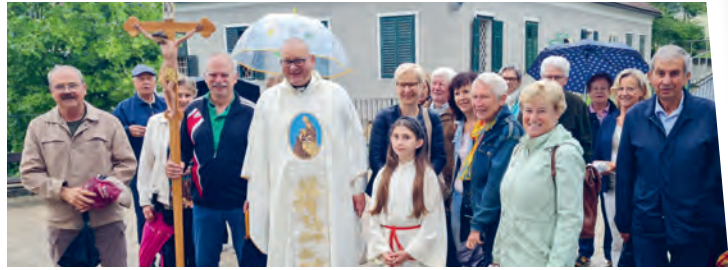
» Wetterfeste Wallfahrer aus Tieschen in St. Anna am Aigen