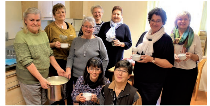
» Organisationsteam in Straden

In Dietersdorf fand eine Wortgottesfeier zum Suppenonntag statt. Nach dem, von den Ministranten mitgestalteten, Gottesdienst wurden die Gottesdienstbesucher zum gemeinsamen Suppenessen auf