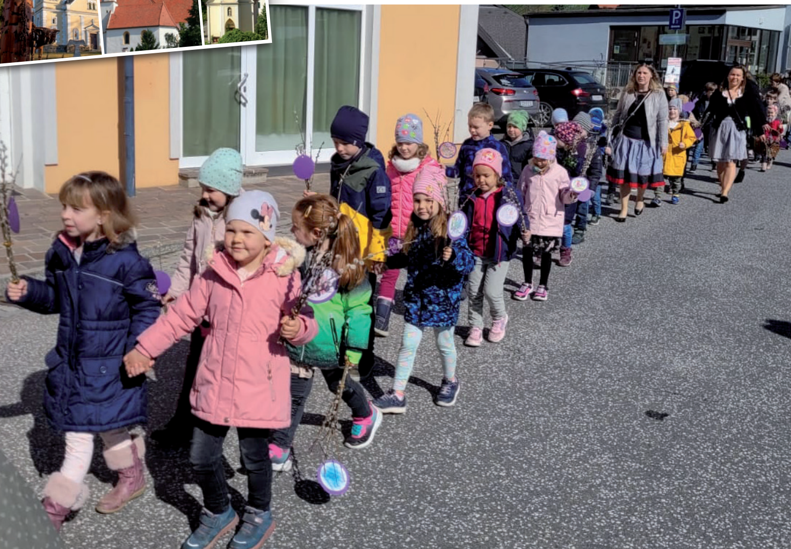
Palmprozession in Straden 2022