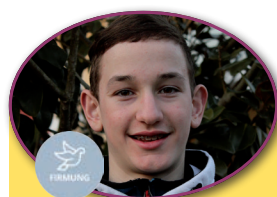
Sebastian Schadler Hof